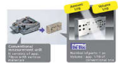
傳統感應器 Uni Bloc感應器